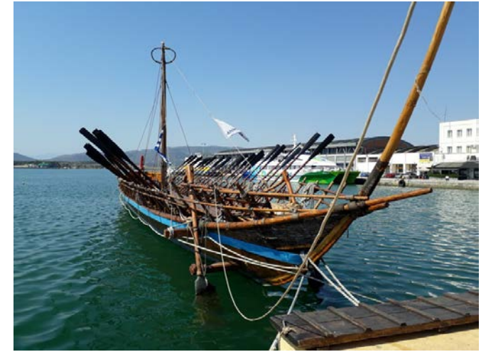
Nachbau der ‚Argo‘ im Hafen von Volos. Der Sage nach begab sich mit diesem Schiff der Held Jason in Begleitung von 50 Gefährten, den ‚Argonauten‘, auf die Suche nach dem Goldenen Vlies.

Studienreise der Klingenden Brücke nach Volos - Griechenland